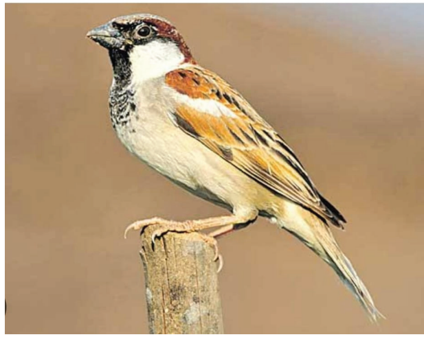
పిట్టలను సరిగ్గా సమయానికి తగ్గట్టు అన్నీ నేర్పిస్తాయి. ఎక్కువగా తినవు. మీరు ఎంతైనా ధాన్యాల వేయండి కొంచెం తిని ఎగిరిపోతాయి. తమతో ఏమీ తీసుకోవు. తీసుకొని పిట్టల కడుపునింపడానికే గానీ దానుకోవడానికే

ప్రేమికులు, పక్షుల ప్రేమికులు, పక్షుల పరిశీలకులు ఏటా జనవరి 5 న జాతీయ పక్షుల దినోత్సవాన్ని జరుపుకుంటారు. ప్రపంచంలోని దాదాపు 10,000 పక్షి జాతులలో దాదాపు 12 శాతం అంతరించిపోయే ప్రమాదం ఉంది. అర మిలియన్లకు పైగా పక్షుల ఆరాధకులు జాతీయ పక్షుల దినోత్సవాన్ని జరుపుకుంటారు. చాలా మంది పక్షుల జాతులను ఈ రోజున పక్షులను దత్తత తీసుకోవడం ద్వారా పక్షుల సంరక్షణలో ఉన్న ప్రత్యేక సమస్యల గురించి, పక్షుల యజమానులకు సరైన సంరక్షణ, శుభ్రత, ఆహారం అవగాహన కల్పించటం. “ పక్కలో సుమారు 10,000 జాతుల పక్షులు ఉన్నాయి. మనజాతీయపక్షి నెమలిని స్మరించుకుందాం.. రక్షించుకుందాం.. మీ పెరటి స్టార్ కార్డినల్ అయినా లేదా ఉద్యానవనానికి తరలివచ్చే సాధారణ పావురాలు అయినా, పక్షులు ఎల్లప్పుడూ మన పూర్వదాల్లో మోహం, ప్రేమ మరియు ఆరాధనను కలిగి ఉంటాయి. ఒక డేగ ఎగురుతూ చూసేటప్పుడు మాత్రమే ఒక నిర్దిష్ట విన్యయం ఉంటుంది. దురదృష్టవశాత్తు, చాలా పక్షులు ప్రమాదంలో ఉన్నాయి. అక్రమ పెంపుడు జంతువుల వ్యాపారం కారణంగా జరుగుతున్నాయి. పక్షుల నుంచి కొన్ని నేర్చుకుందాం.. రాత్రి తినవు, తిరగవు, తమ